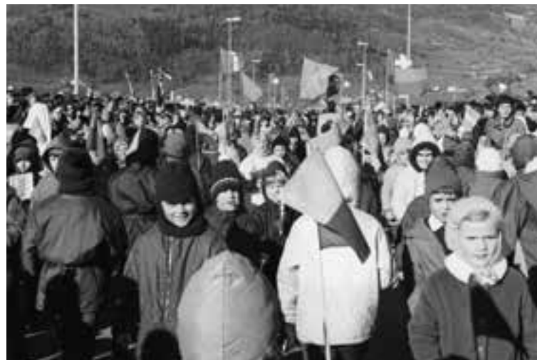
Kontermarsch der Kinder aus Balzers und Wartau an der Eröffnung der neuen Rheinbrücke.