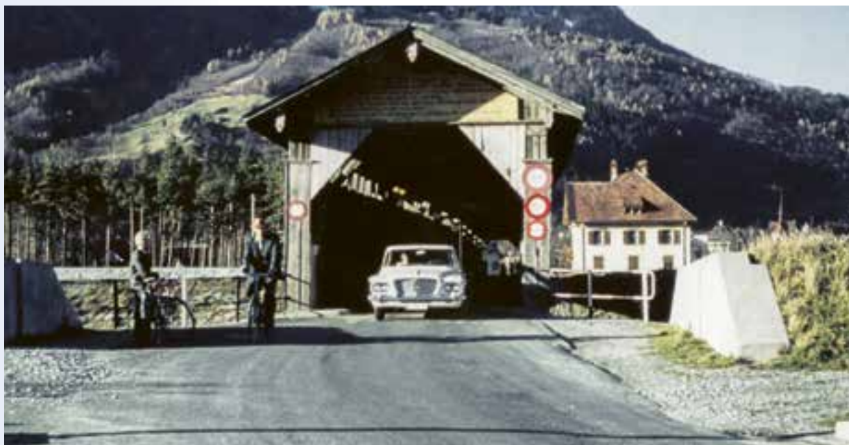
Alte Holzrheinbrücke zwischen Balzers und Trübbach, 1960er-Jahre.

Die alte Holzbrücke diente bis zu ihrem Abbrennen am 11. Oktober 1972 dem lokalen Langsamverkehr. An ihrer Stelle wurde 1975 ein Betonsteg für Fussgänger und Radfahrer errichtet.