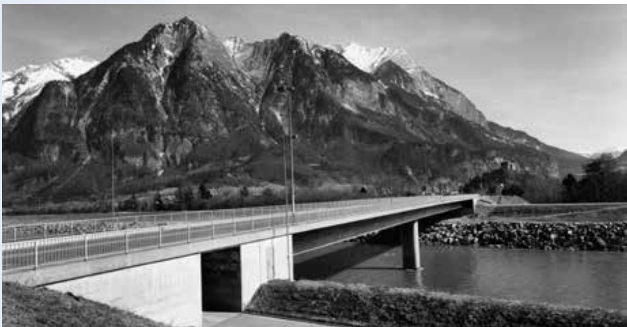
Fertig gestellte Rheinbrücke zwischen Balzers und Trübbach, 1968.